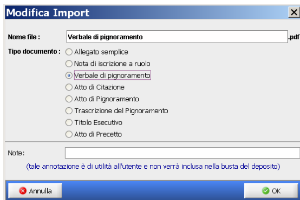
Figura 3 - Selezione del tipo di allegato - Ad es. verbale di pignoramento

Dopo l'allegazione dei documenti, come sopra, si proceda alla generazione della busta, come d'abitudine: iter di firma e invio non ha subito variazione alcuna.